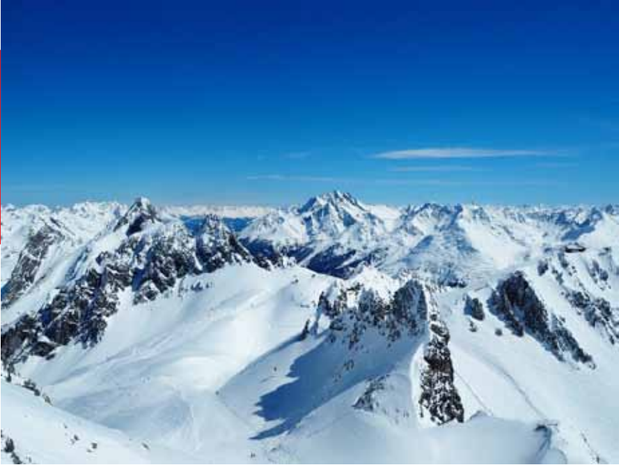
Sankt Antonin laskettelukeskus, Itävalta (2811 m)

Vapaa-aika kuluu melko mukavasti vuorilla joko laskettelemassa tai kiipeilemässä/vaeltamassa. Liechtensteinin oma laskettelukeskus, Malbun on puolen tunnin bussimatkan päässä ja suuremmat keskuksat noin 1,5h bussi- ja junamatkan päässä. Hissilippujen hinnat ovat kohtuullisia, sillä moninkertaisesti Leviä tai Yllästä isommassa laskettelukeskuksessa päivälippu on noin 50€. Rinteitä on usein lähes 100 ja ne ovat yleensä moninkertaisesti pidempiä. Pienemmissä keskuksissa laskettelemaan pääsee noin 30 eurola, myös Sveitsissä ja niissäkin riittää laskettavaa. Parhaimmat laskupäivät ovat olleet Liechtensteinin Malbunissa, kun päivän aikana on satanut