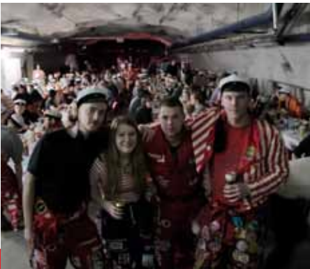
Kirkkaritiimi ja taustalla sitsit.

Kiitokset kirkkaritoimikunnalle, nakkilaisille ja ilman muuta kaikille Kirkastusjuhlavieraille! Ensi vuonna Otaniemi ja allekirjoittaneelle kierros täyteen.