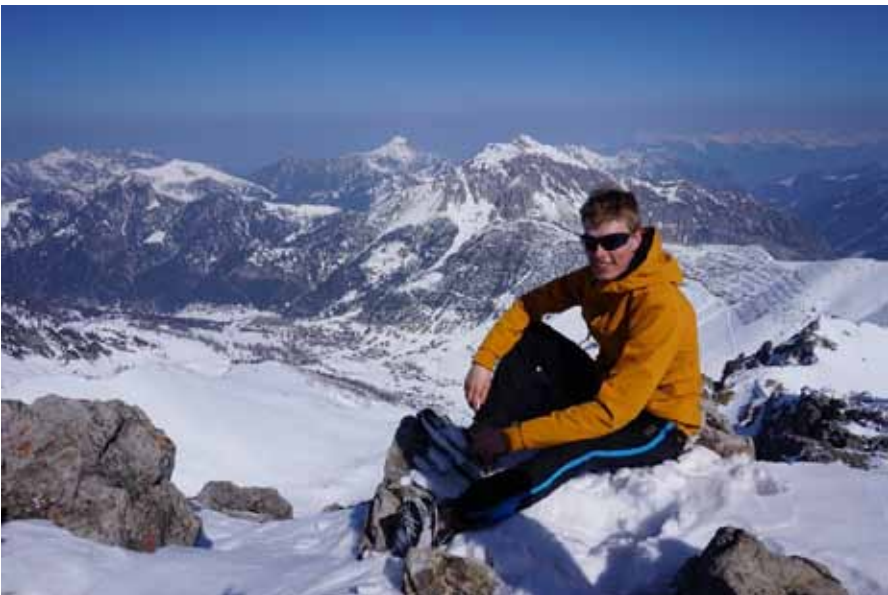
Augstenbergin huipulla (2359 m)

Ulkomaan kirjeenvaihtaja, Mikko Merikoski