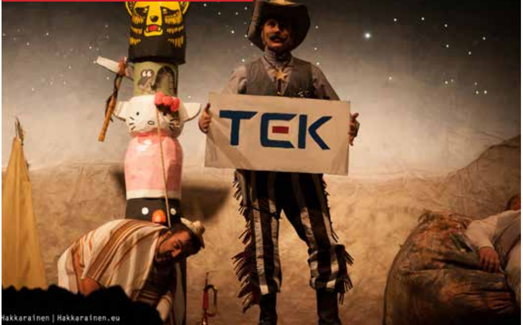
Hakkarainen | Hakkarainen.eu

T EK on diplomi-insinöörien ja arkkitehtien ammattiliitto. TEK:n jäsenenä olet osa diplomi-insinöörien, arkkitehtien ja luonnontieteellisen yliopistokoulutuksen saaneiden tekniikan ammattilaisten sekä alan opiskelijoiden yhteisöä. TEK on lisäksi yksi AKAVAN suurimmista järjestöistä.