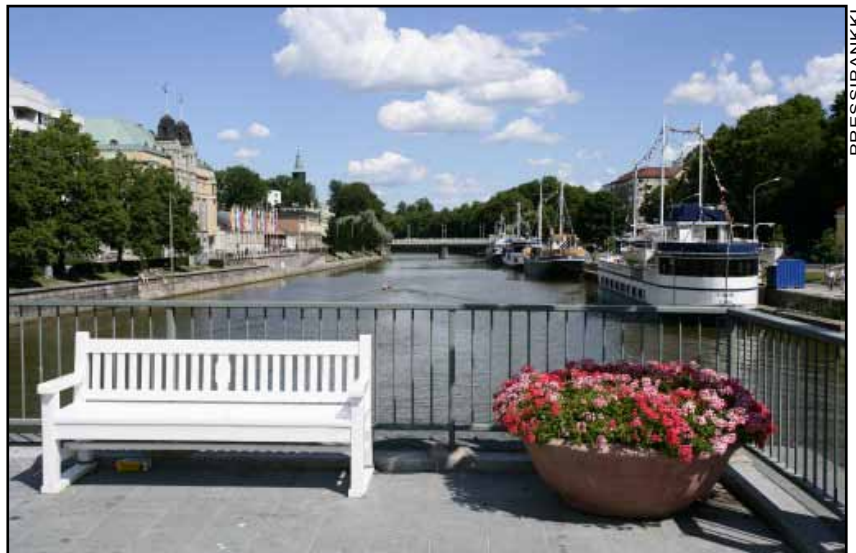
Turun ylpeys - jokilaivat. Kuvan Hervannast näet, kunhan vain katsot ulos ikkunasta

Yleensä jyrkimmät kommentit turusta ovat niillä, jotka eivät ikinä ole käyneet turussa, tai ovat käyneet vain satamassa. Se täytyy vain kokea! Keväällä siihen on hyvä mahdollisuus, kun kaikki tulevat mukaan tamppi-xqille turkuun! (Päätoimittajan huomio: No ei me nyt sinne selvinpäin mennä!) Turku - kaupunki, joka on antanut meille Sedu Koskisen, Ilkka Kanervan sekä Hesburgerin, ja mistä ei varmasti löydy ainoatakaan mustaamakkaraa!