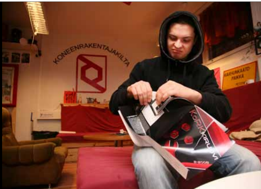
Päätoimittaja harjoittelee ruuvien taittamista