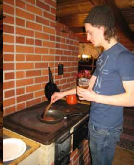
TEKSTI JA KUVAT: ILKKA HURU

"OIKEA ANNOS JALOVIIINAA ON SAAVUTETTU, KUN KUULUU "OHO" TAI VASTAAVA LAUSAHDUS"