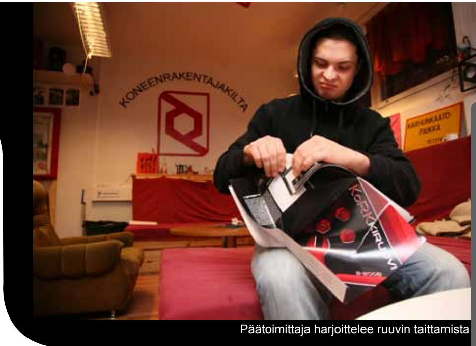
Päätoimittaja harjoittelee ruuvien taittamista