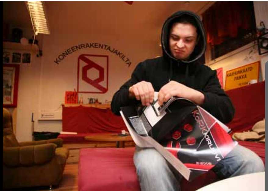
Päätoimittaja harjoittelee ruuvien taittamista