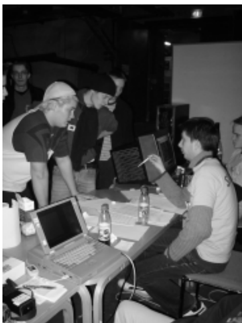
Ihmisten saapuessa ja aikataulujen venyessä info-tiskillä oli kävijöitä reilusti.

MindTrek Ry, joka järjestää Mindtrek mediaviikkoa, etsi koulultamme verkkopelitapahtuman järjestäjää osaksi mediaviikkoaan vuonna 2001. Tämän haasteen otti vastaan juuri perustettu Lanita. Ensimmäinen MTL oli kooltaan noin 250 konepaikkaa sisältänyt tapahtuma jossa muita vierailijoita oli noin 200. MTL'01 oli menestys joten Lanita päätti järjestää tapahtuman uudestaan mutta huomattavasti isompana. Suunnittelu aloitettiin jo aikaisin viime keväänä, ettei tulisi samanlaista kiirettä kuin ensimmäistä MTL'01:stä järjestettäessä.