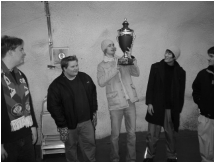
eoLithic, voittivat matkan Dallasiin CPL- Winter Event turnaukseen.