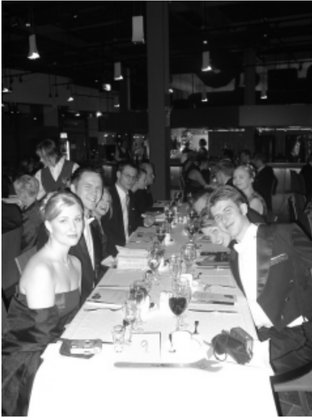
Ilta on vasta nuori, mutta KoRK jo melko vanha.

Nopeaa oli tarjoilu erityisesti heiluttaessamme jakoavaimia, jotta pääsisimme laulamaan ”koneenrakentajakiltaa” .