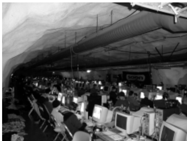
Osallistujilla oli hauskaa pelatessa.

Perjantaina ovien avaamisen jälkeen alkoi ihmisiä valua paikalle. Järjestäjien onneksi