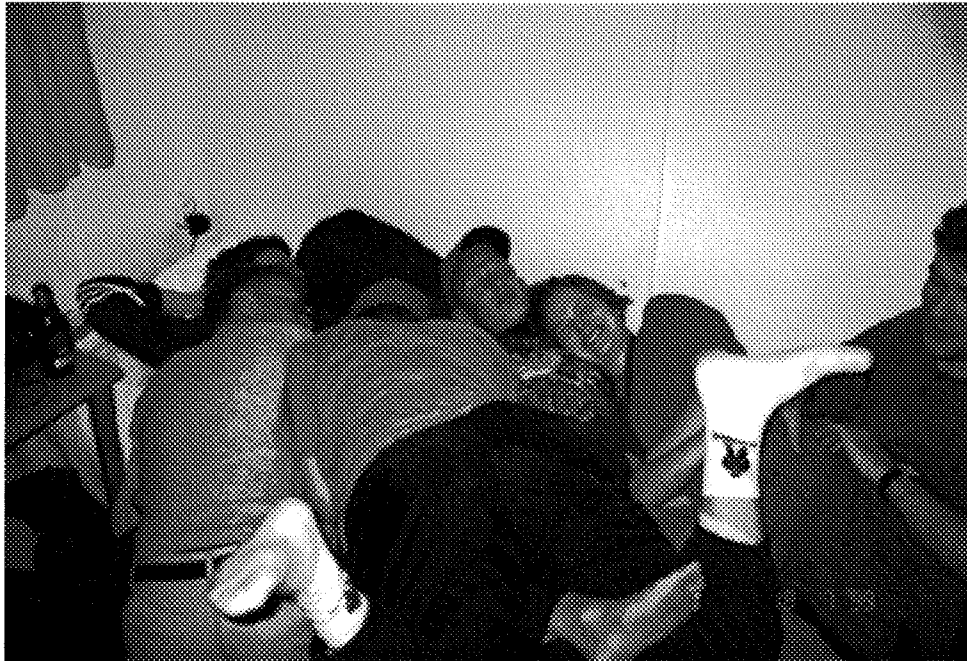
Joskus meno on näinkin kovaa, kun asiantunteva hallitus on liikkeellä.

Eero Kulmala Päätoimittaja Koneinsinöörikiilta