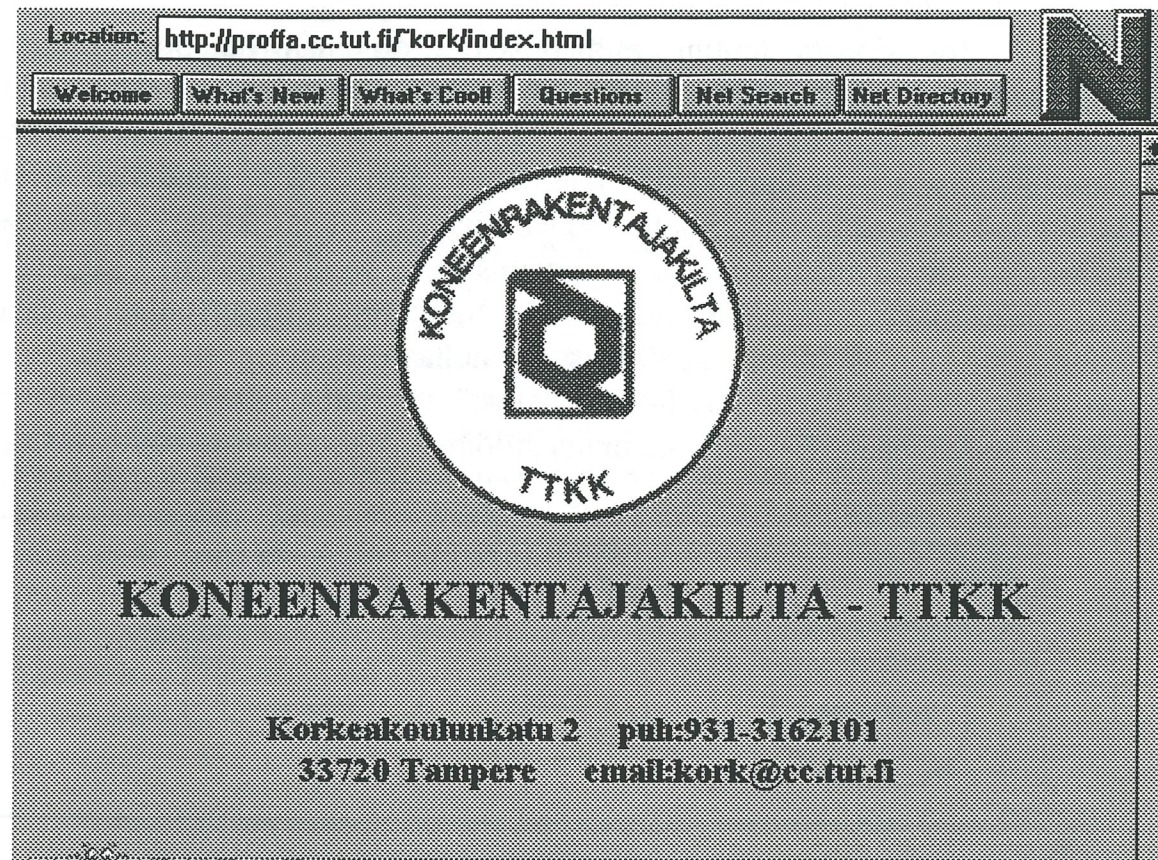
KUVA1: pala KoRKin kotisivua mallia 7.6.1995 Netscape 4 Windowsilla katsottuna

mainiosti, joskin pasianssia pelatessaan Mikko tarvitsee meikäläisen maailmankaikkeuden nopeinta tietokonetta.