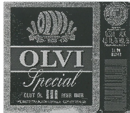
Kuva2. Juoman etiketti

Seuraava on ilmoitus ja nopeimmille täyttä totta Lisäinfo tulee KoRKin ilmoitustaululle