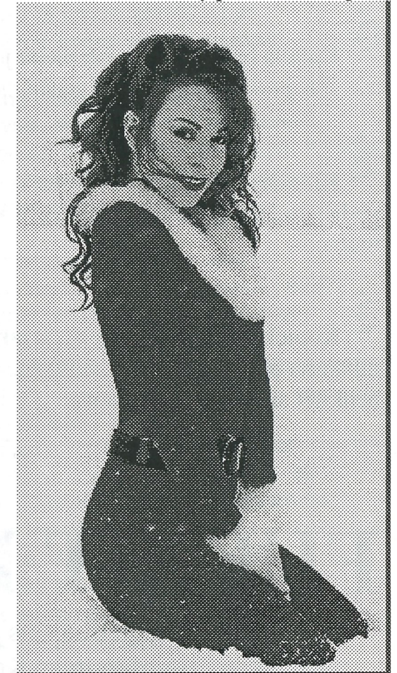
Kuva1. Mariah Carey penkassa istuupi

Yhteyttä päivisin hypernopealle proffa-palvelimelle voi koittaa aikaansaada tietokoneiden välimaastossa sijaitsevalla ns. tyhmällä päätteellä. Sen pitäisi onnistua ilman mahdollisia kirjoitusvirheitä. Ottakaa huomioon, ettei päätettä saa lyödä, vaikka kuinka hermostuisi näppäimistön pitämään aivan turhaan piipitykseen. (Yksi Unix-mailman ihmeellisyyksistä tämäkin.)